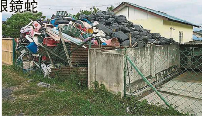
▲回收物堆积如山，几乎已与村屋同高，出入的大门亦被垃圾淹没。