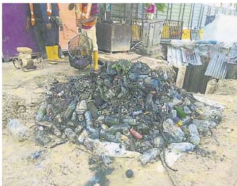
■工友从地底排水沟挖出大量塑胶瓶及保丽龙垃圾，这导致排水不畅通造成发生水灾。