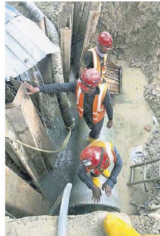
→工友更换破裂的地下水管。