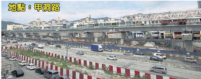
■捷运第二干线双溪毛糯—沙登—布城路线工程施工，造成甲洞路地下水管破裂，路面坑洞处处。