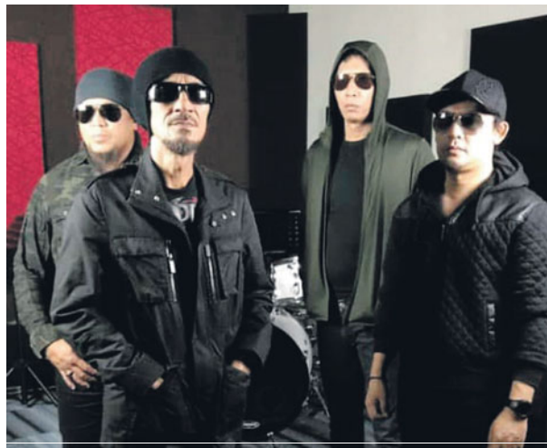
Kumpulan rock popular, XPDC turut memeriahkan Konsert Evolusi PJ, esok.