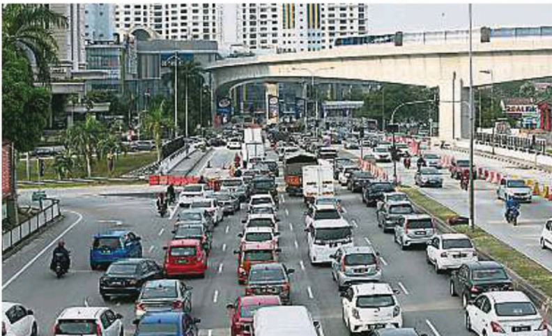
▲梳邦再也市议会将柏西兰格华芝班交通枢纽“自由通行”改道计划期限延长3个星期，即至本月第3个星期为止。