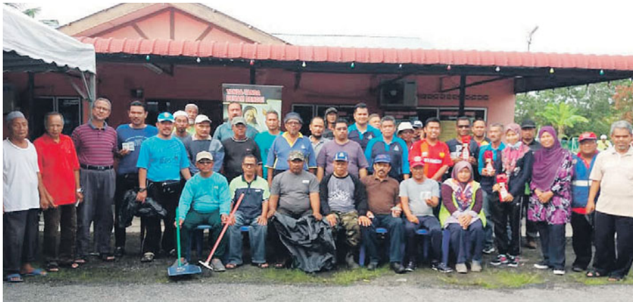
Sebahagian penduduk yang menyertai gotong-royong hapus denggi.