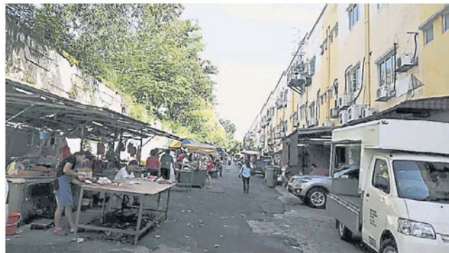
斯嘉城早市小贩将继续争取在原地摆卖。

3地小贩却以3个早市汇集一起将影响他们的生计，及新地点设水电和厕所等设施为由，而拒绝搬迁。