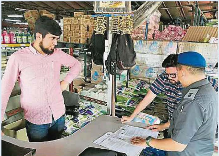
▲ 执法人员向业者了解及检查所售卖的白米。

文告也说, 商家是冒用白米品牌“JATI”, 将一些等级较低的白米包装及销售, 触犯了2011年的商业事务法令第8条文。