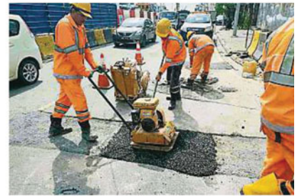
▲承包商已修補甲洞大街的路面，目前等待陸政局重鋪道路。