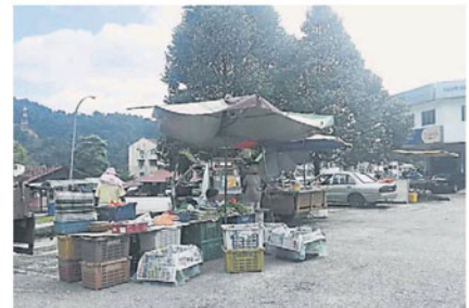
其中3名小贩已在星期三迁往新的地点营业。

据《南洋商报》记者了解，加影市议会10月29日发出最后的搬迁通令给小贩，促请小贩立即迁往300公尺外的蕉赖鸿运花园的新地点营业，惟小贩并不理会，继续原地摆卖。