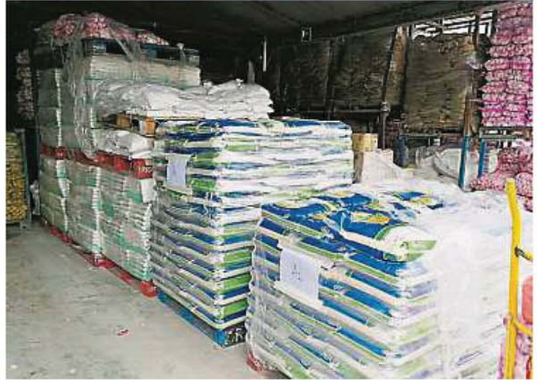
▲ 等价较低的白米冒用知名品牌进行销售。