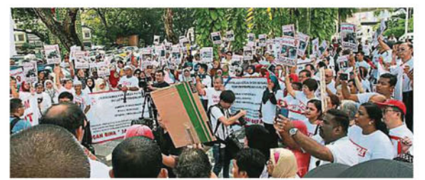
▲尽管反士拉央宰鸡场行动委员会偕同65个团体进行和平请愿时情绪激动,但活动和平安行。