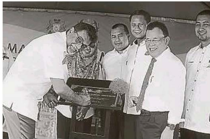
希维尔 (左一) 南下为柔佛河坝开幕，右二是柔佛州务大臣拿督奥斯曼沙比安。