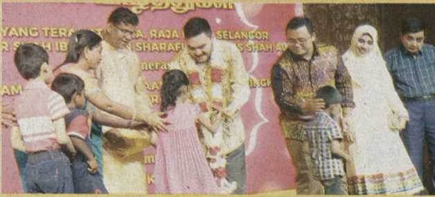
* பட்டத்து இளவரசர் சிறார்கள்ளுக்கு கணிசமான நிதி அன்பளிப்பு வழங்கியபோது