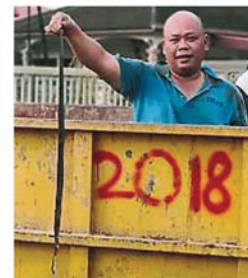
▲在理事们合力打扫下，梁家庭院的垃圾山终于被清理干净。