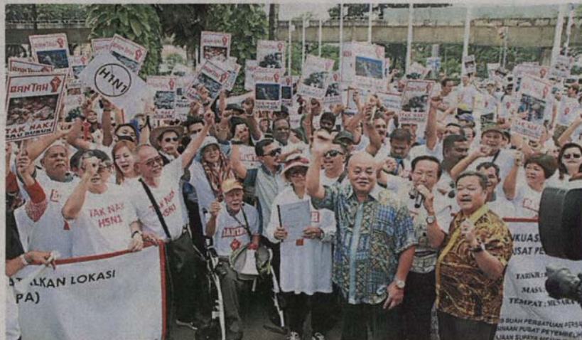
■ 隆坡批发公市旁兴建宰鸡场。八百人出席和平请愿，抗议市政局在吉隆坡

(吉隆坡8日訊) 反士拉央宰鸡场行动委员会今早与65个团体，约800人在吉隆坡市政局广场进行和平请愿，坚决抗议当局在吉隆坡批发公市旁兴建宰鸡场！