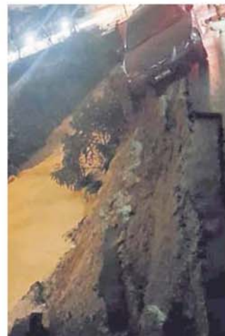
事发当晚，一辆轿车险撞落大沟。