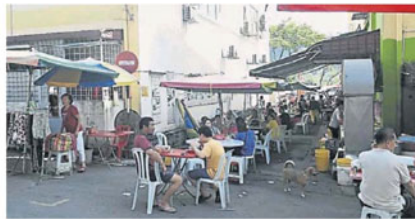
民众坐在横巷喝早茶，旁边就是早市。